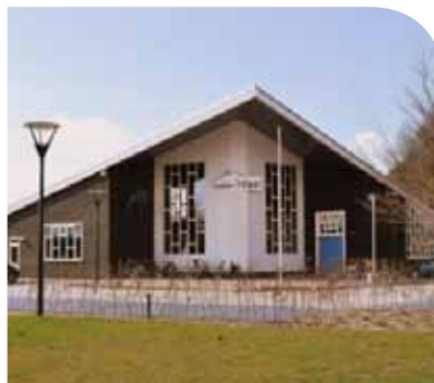
't Trefpunt te Balkbrug

Medewerkers van de provincie zijn aanwezig om een toelichting op de plannen te geven en om uw vragen te beantwoorden. U bent van harte welkom.